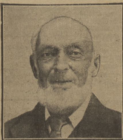
Den Heer TRIM (volgens een foto)